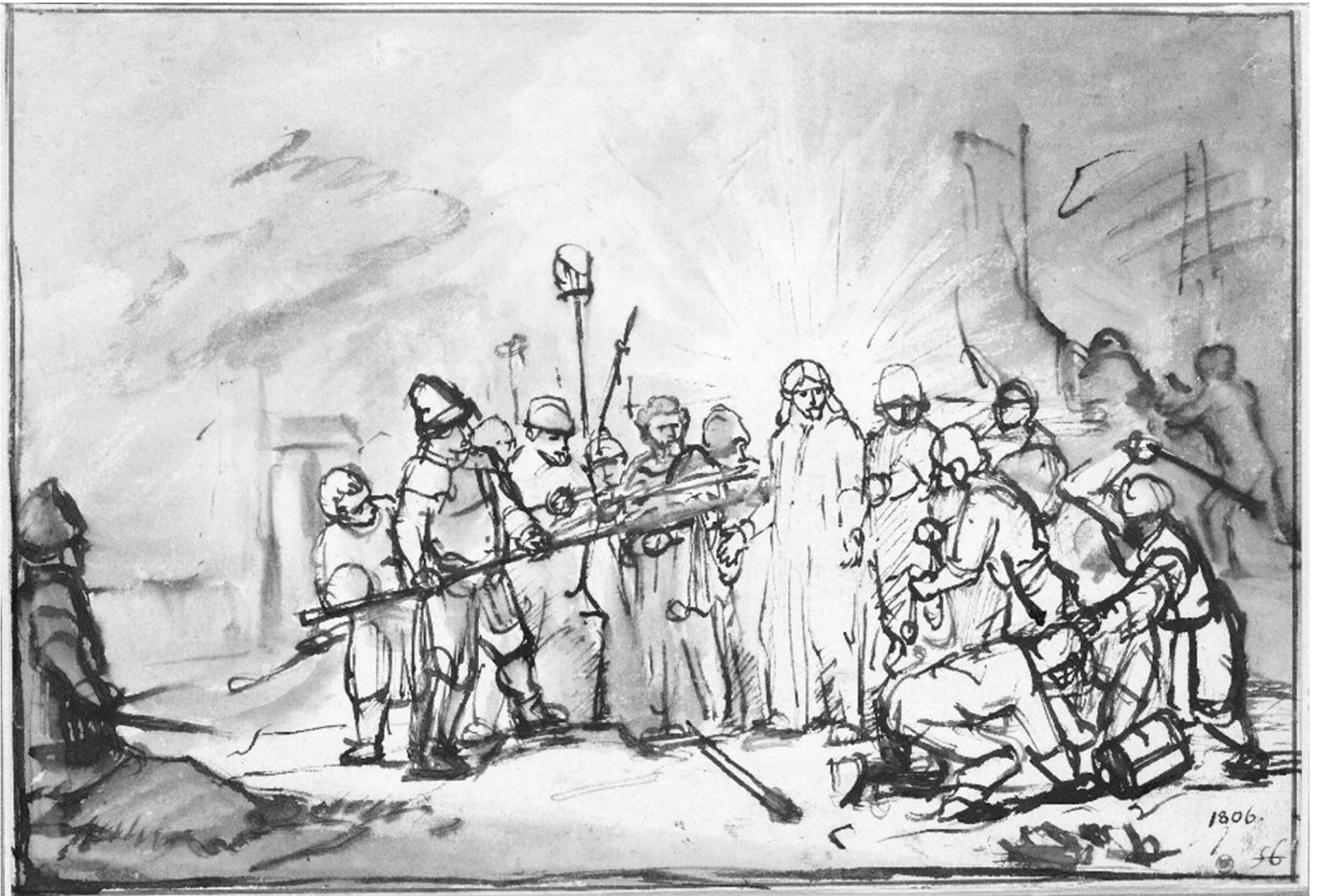
Rembrandt van Rijn: De gevangenneming van Christus, pentekening ca. 1659